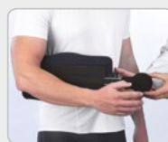
Pelota de ejercicio de mano para mantener el tono muscular y mejorar el riego sanguíneo